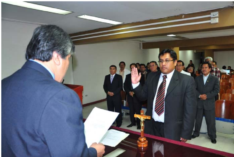
La vista corresponde la Juramentacion del Consejo Regional de Salud el 11-11-11 A cargo del Dr. Julio Segura Perez del Consejo Nacional de Salud