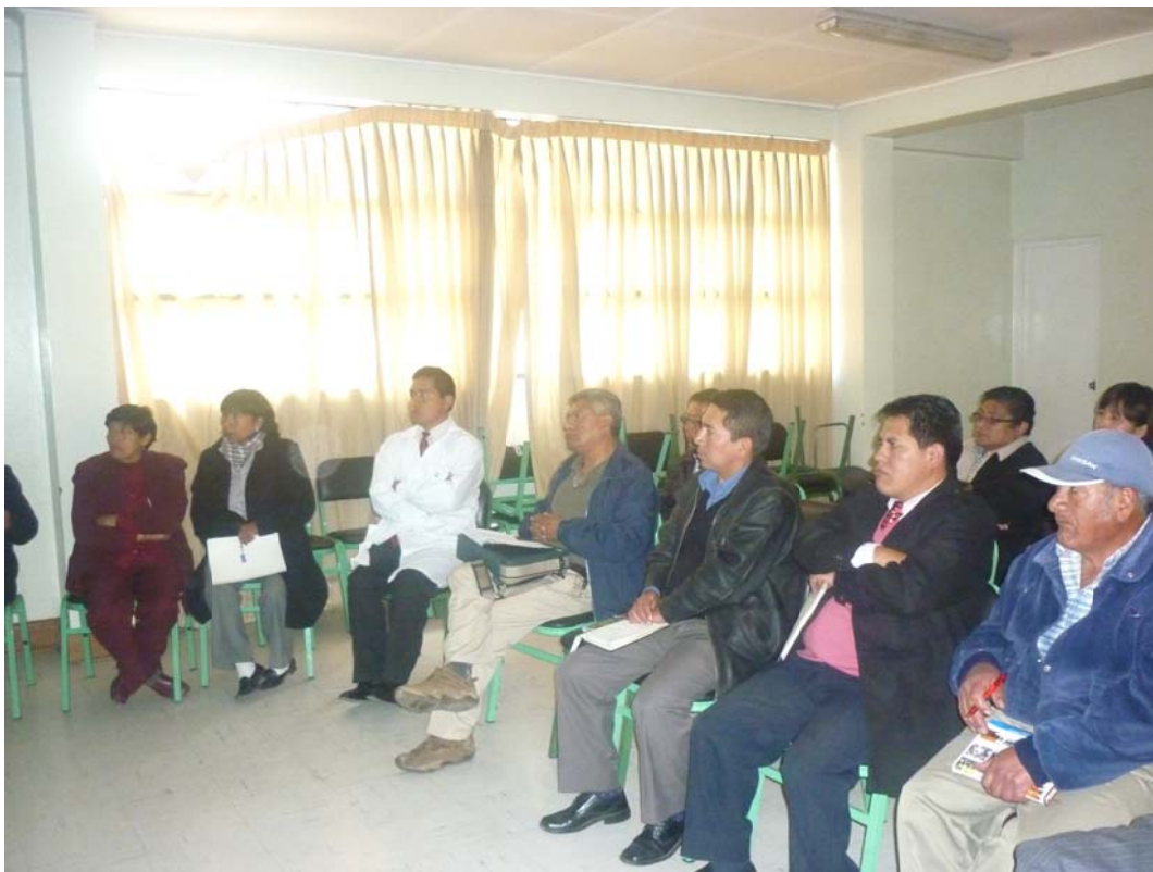
Reunión realizado en la ciudad de Yauli – Oroya con autoridades para informar sobre la activación del Consejo Provincial de Salud

"AÑO DE LA INTEGRACION NACIONAL Y EL RECONOCIMIENTO DE NUESTRA DIVERSIDAD"